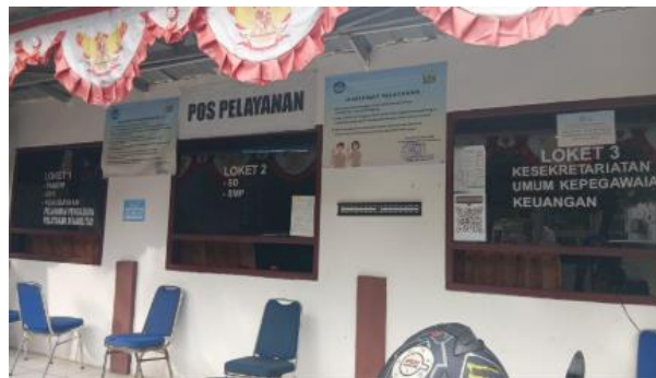
Gambar 4. Pos Pelayanan di Dinas Pendidikan dan Kebudayaan Kota Serang

Responsivitas kebijakan menunjukkan kemampuan program menjawab kebutuhan dan nilai masyarakat. Menurut William Dunn, responsivitas tercermin dari sejauh mana kebijakan memenuhi kebutuhan dan preferensi publik (Nadila, 2023). Berdasarkan hasil wawancara, penerapan SPM Pendidikan SMP di Kota Serang sudah sesuai kebutuhan peserta didik dan sekolah, hal ini tampak dari layanan PAUD, pendidikan dasar, SMP, dan kesetaraan yang berjalan dengan belum adanya keluhan signifikan serta adanya program ATS, pemberian seragam, dan dukungan transportasi bagi siswa kurang mampu. Responsivitas juga diperkuat oleh ketersediaan kanal pengaduan seperti aplikasi RABEG yang bekerja sama dengan Dinas Komunikasi dan Informatika Kota Serang dan pos layanan Disdikbud. Selain itu, peningkatan indikator SPM dan aktivitas literasi menunjukkan dukungan positif masyarakat dan sekolah. Dengan demikian, implementasi SPM di Kota Serang dapat dinilai responsif terhadap kebutuhan dan aspirasi penerima layanan.