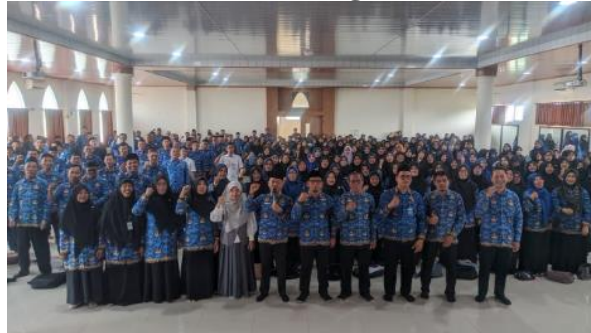
Gambar 5. Pembinaan dan Peningkatan Mutu Guru Agama Islam (PAI) SD dan SMP Se- Kota Serang Tahun 2025