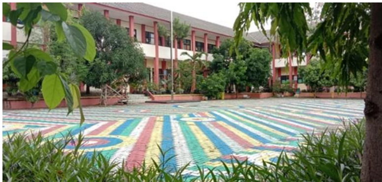
Gambar 3. SMPN 1 Kota Serang

Efektivitas dalam evaluasi kebijakan merujuk pada sejauh mana suatu program mampu mencapai target yang telah ditetapkan dan memberikan hasil nyata bagi penerima layanan. Berdasarkan hasil wawancara dan temuan di lapangan, implementasi SPM pada jenjang ini telah diarahkan untuk tidak hanya memenuhi target administratif, tetapi juga mendorong perubahan pada proses pembelajaran dan hasil belajar siswa. Capaian Indeks SPM Kota Serang tahun 2025 yang mencapai nilai 71,56 dengan status Tuntas Pratama menunjukkan adanya kemajuan dalam pemenuhan indikator prioritas. Literasi tercatat sebagai capaian terbaik, sementara numerasi masih menjadi indikator terendah meskipun mengalami peningkatan signifikan dibanding tahun sebelumnya. Temuan ini mengindikasikan bahwa program peningkatan mutu pembelajaran telah memberikan pengaruh positif, meskipun kemampuan numerasi masih memerlukan penguatan lebih lanjut. Peningkatan nilai indeks juga mencerminkan perbaikan dalam proses pemantauan indikator dan pengelolaan program di tingkat sekolah.